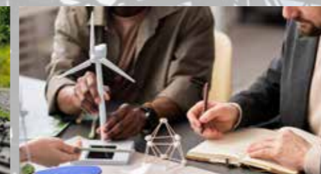
ZAGOTAVLJANJE TRAJNOSTNE INFRASTRUKTURE