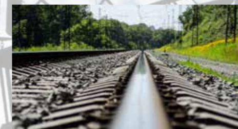
CESTNA IN ŽELEZNIŠKA INFRASTRUKTURA