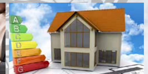
ENERGETSKA SANACIJA STAVB