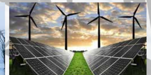
OBNOVLJIVI VIRI ENERGIJE