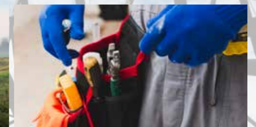
PREDSTAVITEV OBRJNIŠKIH IN INSTALACIJSKIH DEL