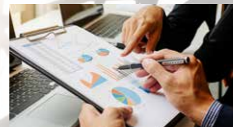
IZZIVI PRIDOBIVANJA IN IZOBRAŽEVANJA KADROV