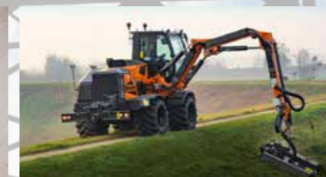
SODOBNA GRADBENA IN KOMUNALNA MEHANIZACIJA